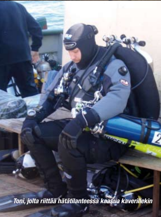
Toni, jolta riittää hätätilanteessa kaasua kaverillekin