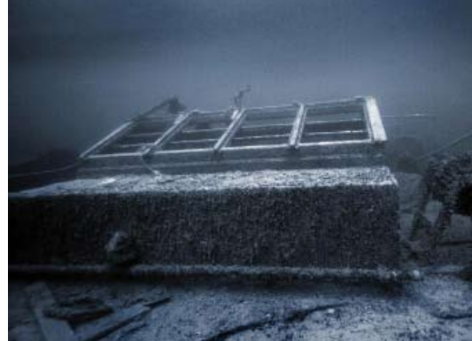
Klaus Oldendorff, Skylet keskilaivan takaosassa Kuva hylt.net, Janne Reinikainen 2006